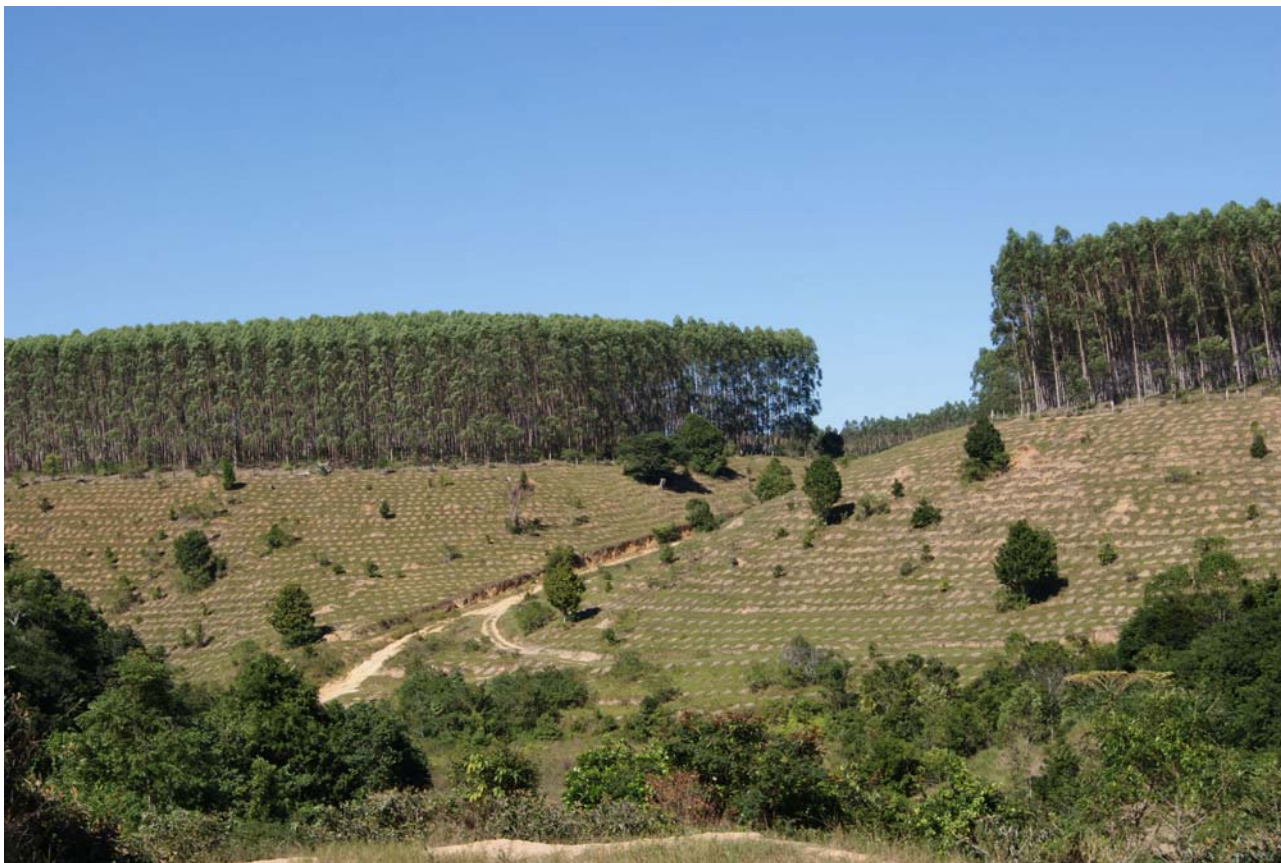
Plantación de Veracel, Bahia.

Basta dar un vistazo a los principales actores internacionales que están detrás de la iniciativa de conservación y al proyecto de compensación de carbono de Monte Pascoal para entender por qué una de las causas principales de la deforestación, es decir la transformación de la Mata Atlántica en plantaciones industriales de eucaliptos a gran escala, parece haber sido estructuralmente olvidada en la documentación del proyecto: las grandes ONG conservacionistas que son las principales defensoras del proyecto están estrechamente relacionadas con Veracel, la mayor compañía plantadora de la región.