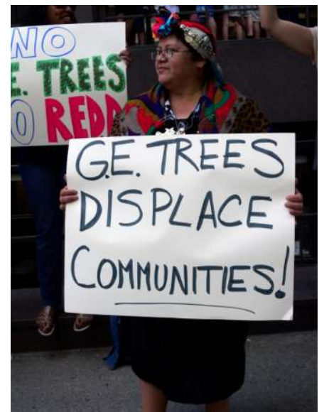
Líder mapuche en la Conferencia de las Naciones Unidas sobre Cambio Climático 2009

El grupo Angelini en tanto a través de Forestal CELCO y Arauco, poseen más de un millón doscientas mil hectáreas. Esta situación ha contado con políticas de fomento del Estado, que por más de cuatro décadas ha financiado este destructivo modelo por medio del Decreto Ley 701, figura bajo la cual el Estado entrega subsidios directos a las empresas forestales, que han alcanzado hasta el 90% del costo de sembrar estas “especies exóticas”.