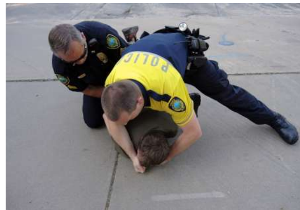
Protestas contra árboles transgénicos en reunión de IUFRO en 2013 en U.S.

Ha habido muchas, muchas protestas en los invernaderos de empresas madereras, conferencias forestales y