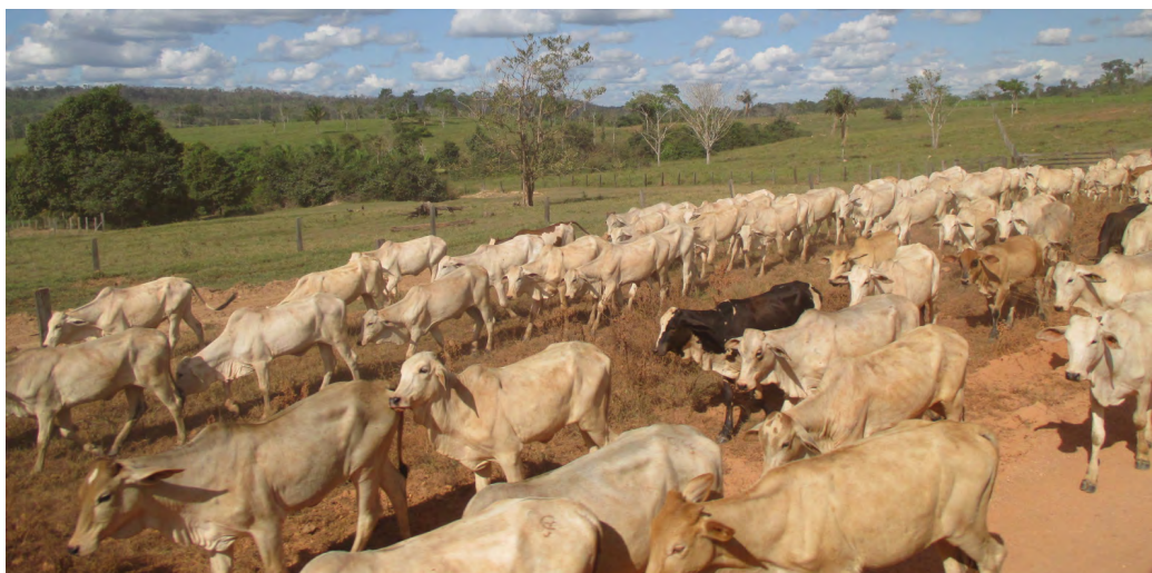
Gado e pastagens na região de Colniza.

Ainda sobre o que de fato aconteceu entre 1975 e 1991, período que não é comentado no relatório do projeto FSM-REDD, moradores da região e também documentação disponível apontam que, em vez da