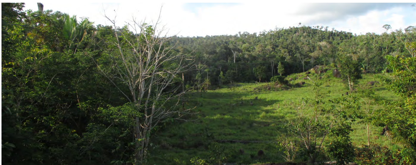
Limite da área do projeto REDD.

O projeto de REDD Florestal Santa María (FSM-REDD) cobre quase 70.000 hectares da Amazônia brasileira e vendeu créditos de carbono a programas de compensação de, pelo menos, duas companhias aéreas: Delta Airlines e TAP. Por trás dele se esconde um aumento no desmatamento na região e um histórico de concentração de terras, uso de certificações que não valem mais e promessas não cumpridas às comunidades locais.