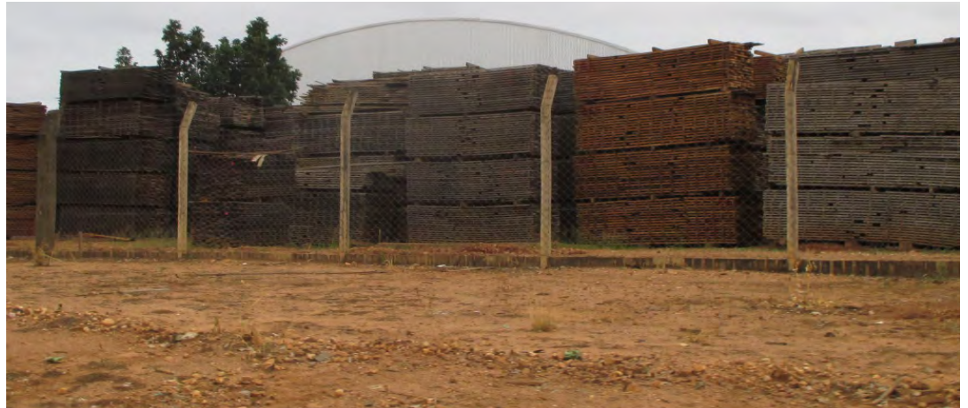
Empresa madeireira em Colniza.

madeira, inclusive áreas de preservação permanente – que deveriam ser estritamente protegidas pela lei – afetadas pelo corte de madeira, e ausência de muitos planos e ações que deveriam fazer parte do chamado “manejo florestal sustentável”. (16)