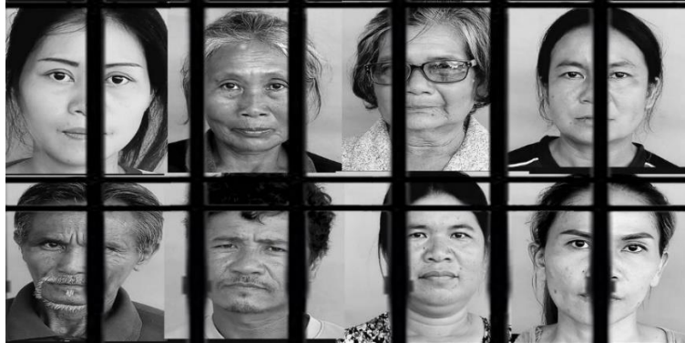
ชาวบ้านที่ถูกฟ้องดำเนินคดีบุกรุกอุทยานแห่งชาติไทรทอง จังหวัดชัยภูมิ ศาลพิพากษาจำคุกและจ่ายค่าเสียหายแก่รัฐ

ระหว่างปี 2557 – 2562 มีการฟ้องร้องชาวบ้านจำนวนราว 46,600 คดี ในข้อหาบุกรุกพื้นที่ป่า ตัวอย่างเช่นที่ จังหวัดชัยภูมิ โดยการบังคับใช้กฎหมายอุทยานแห่งชาติ ชาวบ้านถูกจำคุก ถูกขับไล่ออกจากที่ดิน และถูกฟ้องเรียก ค่าเสียหายที่มีแก่อุทยานแห่งชาติ