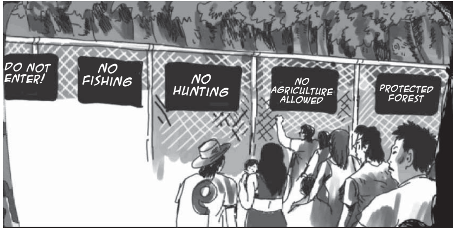
Tsy azo hidirana / Tsy azo hanjonoana / tsy azo hihazàna / Tsy azo hambolena / Ala voaaro

nanimba ny ala tanteraka afaka X taona ho avy, fa ny tetikasa fanonerana afaka hanavotra azy ". Mandeha manazava amin'izay ireo tompo'ny tetikasa fanonerana , any anatin'ny tatitra fampirantiana ilay tetikasa, ahoana ny fomba hampitsaharany ny fomba fambolena nentim-paharazana na ny fampiasana hazo ho an'ny filàna ao an-toerana, na ahoana ny fomba hamerenany ny tany izay nosimbain'ny fampiasana ao an-toerana.