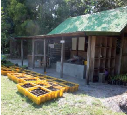
Tanin-janakazo ao amin'ny sampana Fanofanan'ny Rio Tinto QMM ao Mandena.

“Nanaovany fampianarana momba ny fitantanana vola izahay saingy sarotra be loatra. Indrindra ho an'ireo tsy mahay mamaky teny, na ho an'ireo izay tsy dia nahavita fianarana be loatra koa aza. Tsy nisy nahazo izay nolazainy.”