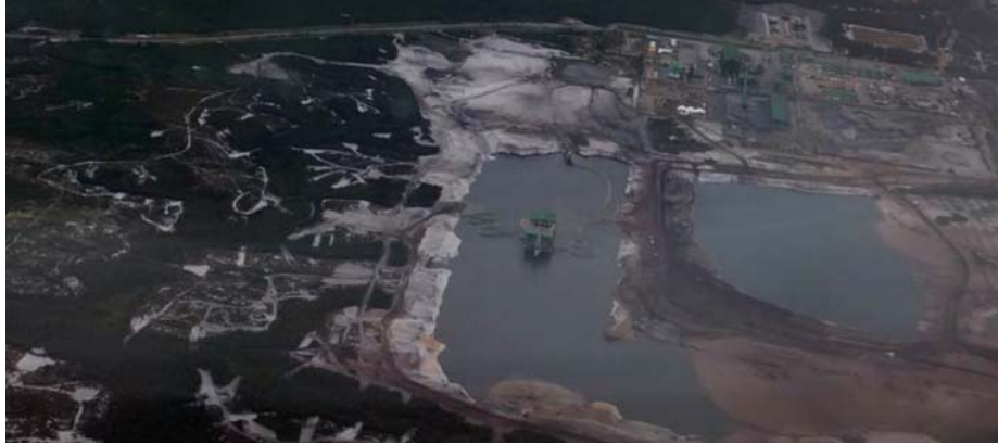
Fahitana avy eo amboniny ny toby fitrandrahan'ny Rio Tinto QMM fasimaintsy ao Taolagnaro (Fort-Dauphin, ao atsimo-atsinanan'i Madagasikara

na havesatry ny fiantraikany eo amin'ny harena voajanahary, saingy tsy afaka manakana tanteraka azy ireo (...). Ohatra amin'ireo fepetra ireo ny fanentanana sy fampianarana ireo mpamily kamiao mba hanaja ny hafainganam-pandeha tsy azo hihoarana mba hampihena ny isan'ny lozam-piarakodia.