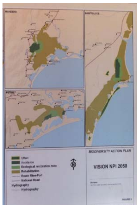
Sarin-tany mampiseho ireo toerana ampiharana ny Drafitr'asan'ny Rio Tinto momba ny fanonerana ny voajanahary ao Madagasikara.

Ny faritra fitrandrahana azon'ny orinasa ("concession minière") dia midadasika eo amin'ny 6 000 hektara eo. Ny fasimainty dia hotrandrahana amin'ny toerana telo (3) – Mandena, Sainte-Luce ary Petriky – anatin'ny faritra izay lehibe indrindra ny sakany. Araka ny filazan'ireo tompony dia afaka mamokatra akoran'ny fasimainty hatramin'ny