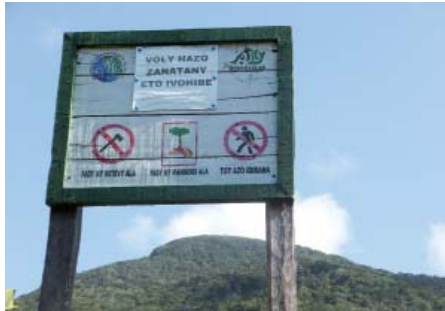
Takela mitsatoka eo am-pidirana an'i Bemangidy-Ivohibe, faritra fanonerana voajanahary. Voasoratra eo : « Ala voajanahary. Fady ny manapaka hazo. Fady ny mandoro ny ala. Tsy azo idirana »

“Nandritra ny fifampiresahana, dia nanazava ireo tantsaha fa tany am-boalohany dia nisy resaka fa hamboly kininina manakaiky ny tanàna, mba ahazoana hazo hatao kitay sy hanamboarana trano. Nisy andrana fambolena vitsivitsy, saingy najanona dia tsy nisy hazo nambolena. Nolazain'ireo tantsaha ireo fa rehefa manontany izy ireo hoe oviana ny fambolena kininina manodidina ny tanàna no hanomboka dia novaliana hoe 'tsara kokoa ny mamboly hazo efa naniry teto ho an'ny razanareo, toy izay kininina manamorona ny lalana'. (Jereo koa toko faha-6.) Saingy tsy nisy hazo avy eo an-toerana nambolena eny amin'ny sisin-dàlana izay mety ho azon'ny mponina nalaina mba ahazoany hazo”