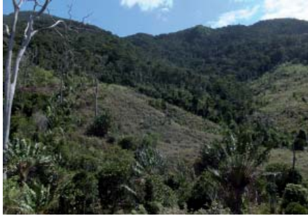
Ny ala "voaaro" ao Tsitongambarika, manamorona an'i Bemangidy, toerana ampiarana ny drafitr'asa fanoneran'ny Rio Tinto QMM harena voajanahary.

ny faritra Bemangidy ho "fiarovana" raha sendra tsy mahomby ny asa fanonerana any amin'ny toeran-kafa (28). Rehefa nesorina avy tao amin'ny lisitra voalohany momba ny faritra mety ho tafiditra amin'ny paikady fanonerana ny harena voajanahary-n'ny Rio Tinto ny faritra fiarovana ao Ambatotsirongorongo izay iaraha-mitantana amin'ny Wildlife Conservation Society, dia ny faritra Bemangidy no voatendry hisolo azy. (29)